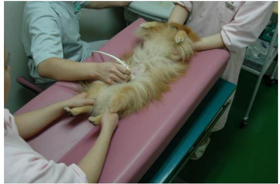
腹 部 エ コ ー

心臓超音波検査の際は、V字パッドを外し、既存の診察台から、動物の大きさにも依りますが、検査者側にマットをスライドさせ使用致します。