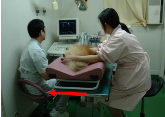
心 エ コ ー